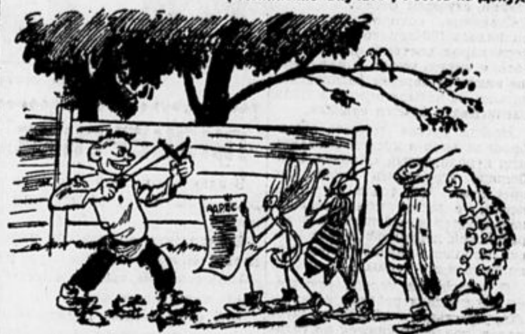
Птичек Петька бьет беспечно; И вредители сердечно, Перед Петькой ставши в ряд, Дурака благодарят.