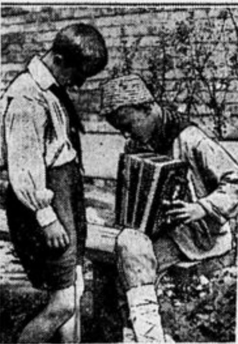
Первый урок игры.