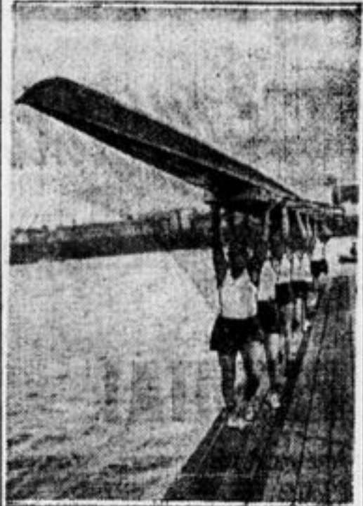
Спуск восьмерки на воду (водная станция «Динамо»).

В то время как в СССР физкультура призвана охранять