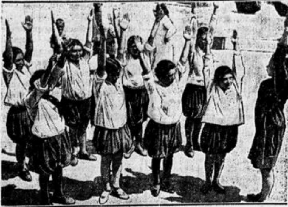
На всеузбекском празднике физкультуры.

Им предстоит тяжелая борьба с пьянством, они ведут ее, вырывают из рук алкоголя ребят. Они устраивают спектакли, вы-