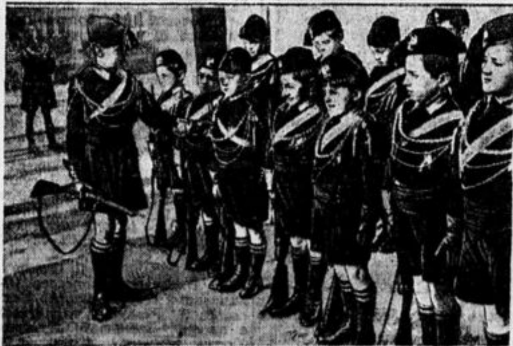
Отряд Вапилл, фашистской детской организации в Италии, обучается владению оружием.