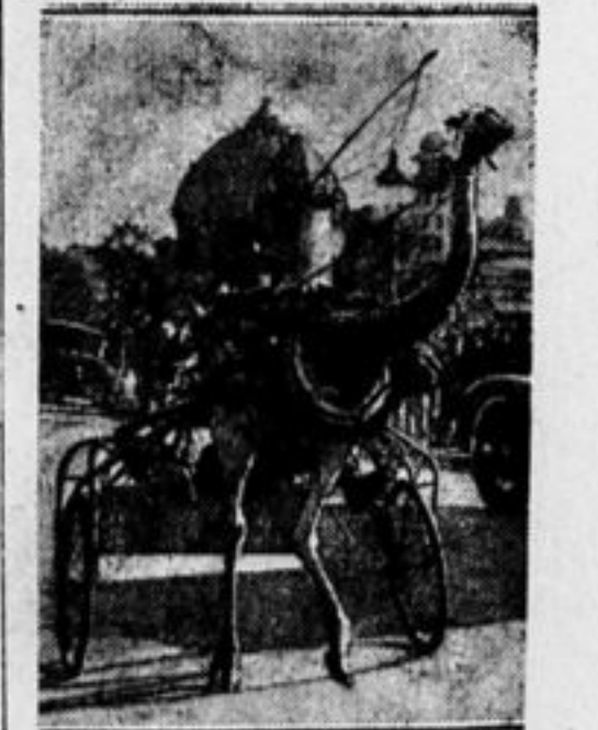
Оригинальная упряжка богатого американца—страус вместо лошади.