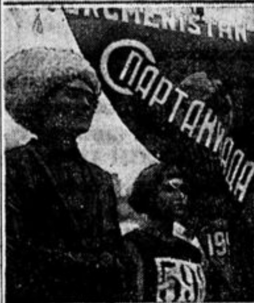
Туркмены на параде.

Но 12 августа Красная площадь преобразилась—точно на ней за одну ночь разбили громадный цветник из ярких цветов. Голубые, зеленые, красные, белые квадраты, среди которых возвышались ярко-красные знамена, лозунги, плакаты. 23.000 физкультурников выстроились перед мавзолеем в честь открытия Всесоюзной Спартакиады.